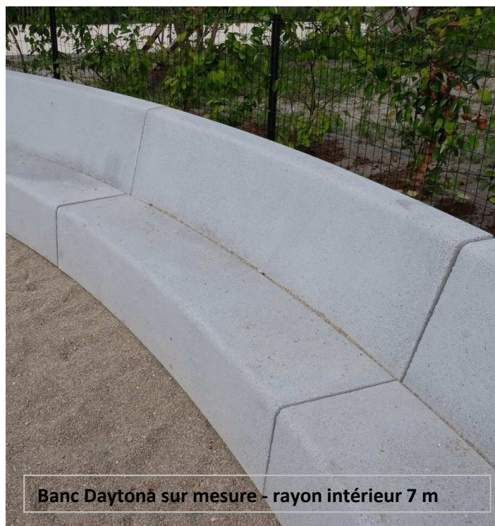
Banc Daytona sur mesure - rayon intérieur 7 m